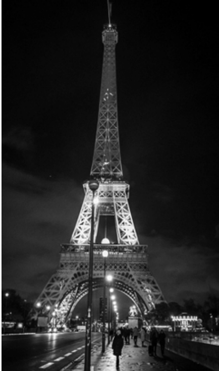
La tour Eiffel á Paris